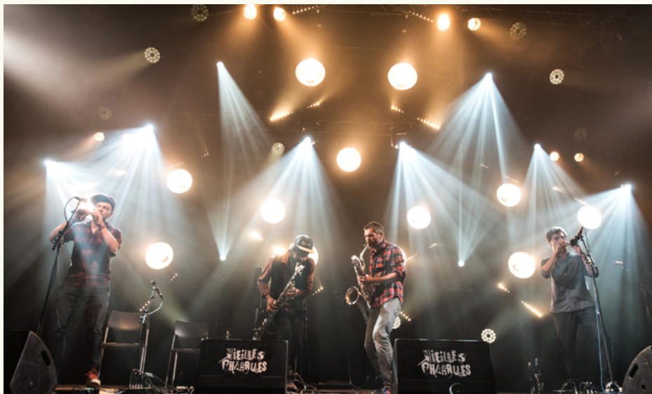
FESTIVAL LES VIEILLES CHARRUES 2019